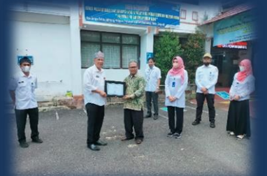
Penyerahan Penghargaan Kepada Pemohon