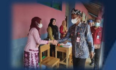
Pelayanan Keliling Perizinan Berusaha