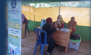
Pelayanan keliling di Desa