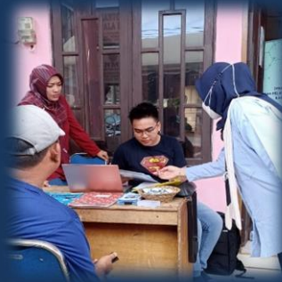
Bimbingan Teknis OSS di Desa