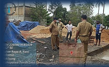
Cek Lapangan Permohonan IMB